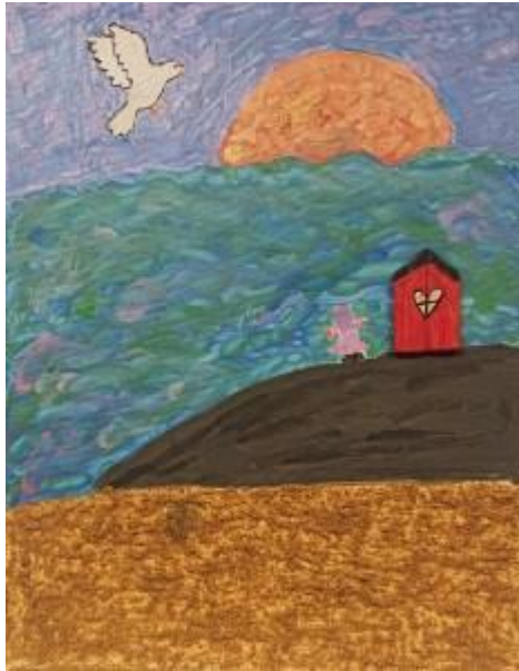
"Freden i drömvärlden" av Caroline Johansson Blandteknik i akryl, sand och trä.

En vit duva flyger i riktning mot en kopparfärgad sol som halvvägs är på väg ned, eller upp ur ett hav med böljande likformiga vågor i olika blågröna och rosa färgskiftningar. På en brun kulle står ett litet rött hus med svart tak och ett hjärtformat fönster. Till vänster om det lilla röda huset står en person i en rosalila klänning och svarta skor. Längst ned skiftar en strand i guldbruna kulörer. Konstnären har lagt på ett tunt lager med sand som gör att verket får en sträv sandpaperliknande struktur.