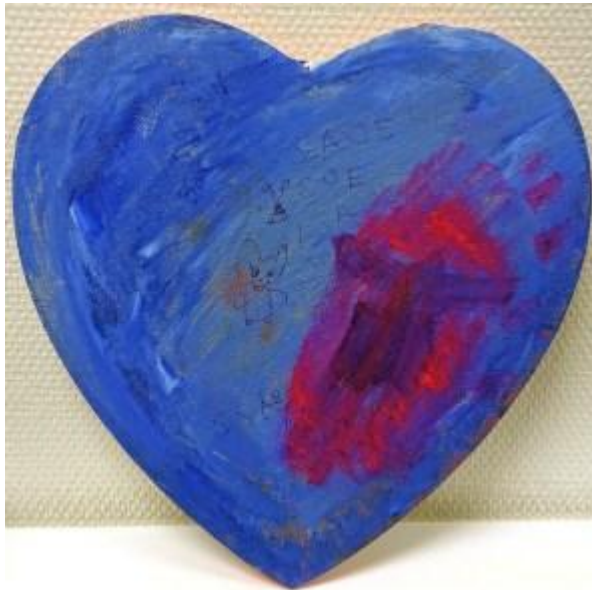
”Hjärtat” i akryl på trä av Sabina Wyke.

Streckfigurens ben är långa och avslutas i ett par svarta och klumpiga runda skor med hög klack.