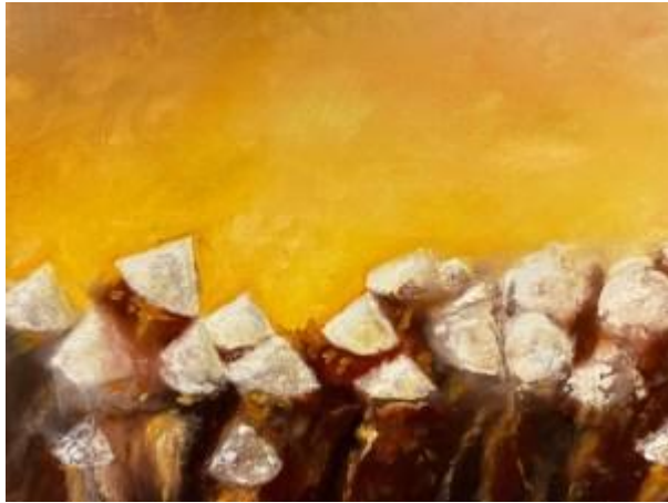
”Vietnamesi skor” av Kane Bengtsson. Akryl på duk.

En målning där den från botten och upp till hälften är full av ett tjugotal vita trianglar som lutar åt lite olika håll. Under trianglarna skymtas diffusa konturer av människokroppar. Konturerna är mörkbruna och smälter ihop och det verkar som om gruppen av människor är på väg mot höger ut ur tavlan. Ovanför gruppen av människor lyser himmelen gul och orange som om den brinner.