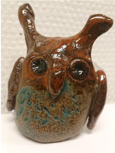
Bränd lerfigur av Irma Lindberg.

En ca 5 cm hög brunaktig lerfigur med ugglelikt utseende. Den är glaserad och blank. Till formen är den oval och har inga ben. På var sida av huvudet har den hornliknande tofsar som är oregelbundna i formen och står rätt upp. Den har stora konkava runda ögon som är mörkt bruna ristade med streck från centrum av ögat och utåt. Mellan ögonen har den en näsa eller en näbb som böjer sig ner över det ljusare bruna bröstet som är dekorerad med turkosa stänk. Längs med sidorna har den bruna vingar eller armar.