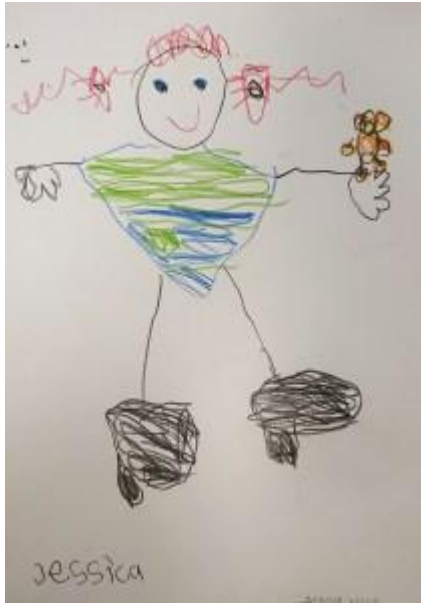
”Jessica” blandteknik av Sabina Wyke.

En streckfigur på vitt papper i naivistisk stil. Figuren har ett runt stort ansikte med två svarta prickar som ögon och ett rött u-format streck som en glad mun. På huvudet har hon en röd lockig lugg. Från var sida av huvudet sticker tofsar eller flätor ut i öronhöjd. De är också röda och lockiga.