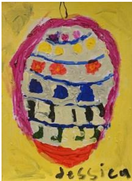
”Jorden i ett påskägg”. Akryl av Jessica Hansson.

En stående rektangulär målning. Bakgrunden är djupt blå längst upp och rätt så snart nedanför blir bakgrunden murrigt blågul och flyter över i olika gröna och gula nyanser. Vita korta diagonala stänk, där början är lite tjockare som en droppe, har dragits ut till ett tunnare streck som verkar regna över bakgrunden. I mitten på den vänstra sidan av målningen finns det ett rött föremål som är rakt uppe på och bågformat under till som en halvcirkel. På den platta delen har den ett avlångt vitaktigt segel som pekar åt höger. Längre ner i mitten finns det en djupblå triangel som har två större beigegula triangelformade segel som också de verkar böja sig i vinden.