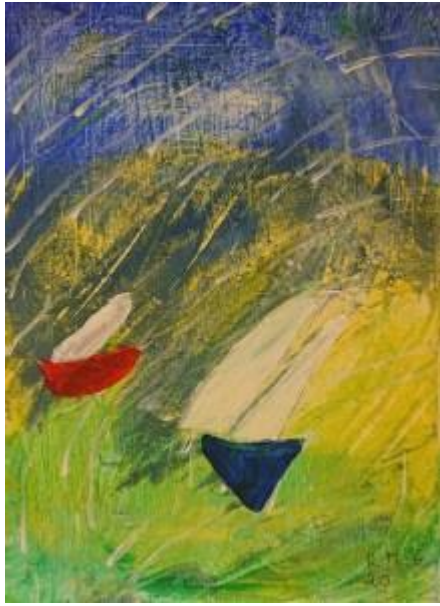
”Kappsegling” av Rose Marie Grevholm. Akryl.

En stående rektangulär målning. Bakgrunden är djupt blå längst upp och rätt så snart nedanför blir bakgrunden murrigt blågul och flyter över i olika gröna och gula nyanser. Vita korta diagonala stänk, där början är lite tjockare som en droppe, har dragits ut till ett tunnare streck som verkar regna över bakgrunden. I mitten på den vänstra sidan av målningen finns det ett rött föremål som är rakt uppe på och bågformat under till som en halvcirkel. På den platta delen har den ett avlångt vitaktigt segel som pekar åt höger. Längre ner i mitten finns det en djupblå triangel som har två större beigegula triangelformade segel som också de verkar böja sig i vinden.