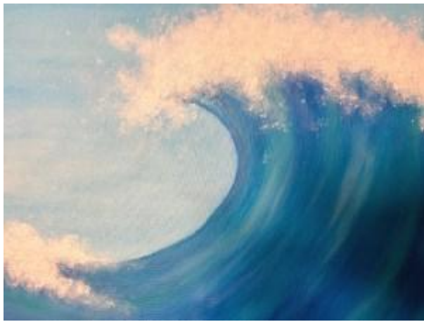
”Inevitable splash” av Alice Andersson. Akryl på papper.

En målning där den från botten och upp till hälften är full av ett tjugotal vita trianglar som lutar åt lite olika håll. Under trianglarna skymtas diffusa konturer av människokroppar. Konturerna är mörkbruna och smälter ihop och det verkar som om gruppen av människor är på väg mot höger ut ur tavlan. Ovanför gruppen av människor lyser himmelen gul och orange som om den brinner.