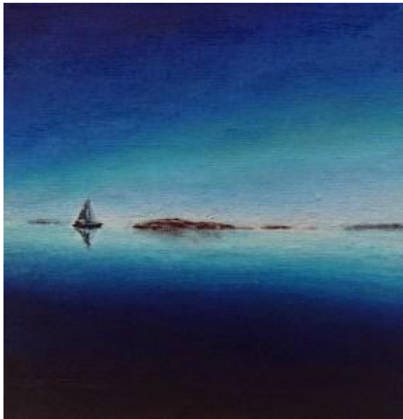
"Havet" Av Robert Appelgren. Akryl på duk.

En vit duva flyger i riktning mot en kopparfärgad sol som halvvägs är på väg ned, eller upp ur ett hav med böljande likformiga vågor i olika blågröna och rosa färgskiftningar. På en brun kulle står ett litet rött hus med svart tak och ett hjärtformat fönster. Till vänster om det lilla röda huset står en person i en rosalila klänning och svarta skor. Längst ned skiftar en strand i guldbruna kulörer. Konstnären har lagt på ett tunt lager med sand som gör att verket får en sträv sandpaperliknande struktur.